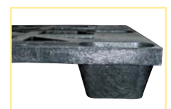
Taco para encajar