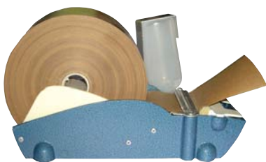
Humectador manual para cortar tiras a medida.