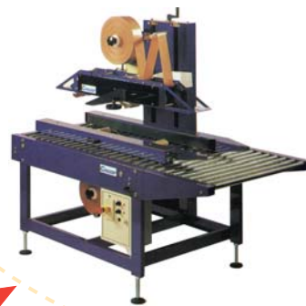
máquinas no suministradas