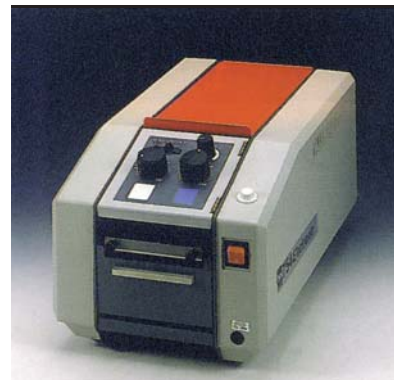
Máquina electrónica. Corta tiras engomadas desde 15 hasta 250 cm de largo. Tiene tres posiciones de trabajo que la convierte en la máquina más versátil del mercado.