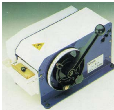
Máquina mecánica. Corta tiras engomadas prefijadas desde 10 hasta 80 cm de largo.