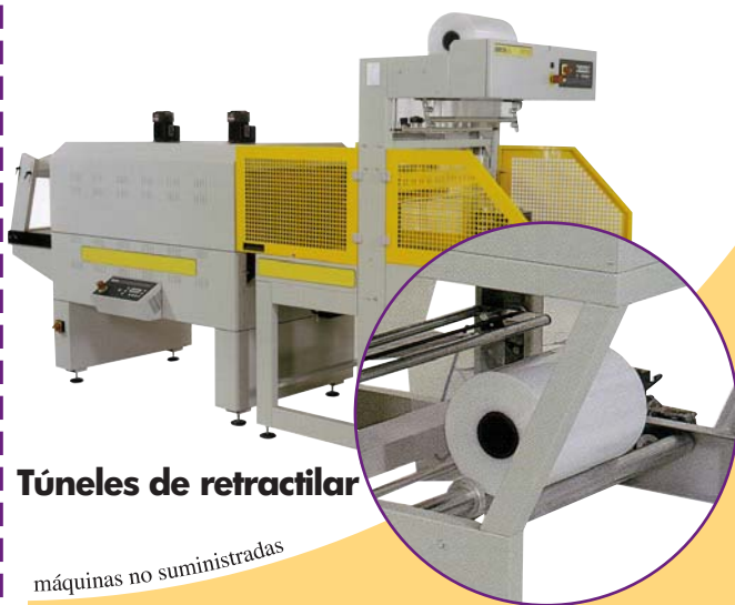
Túneles de retráctil