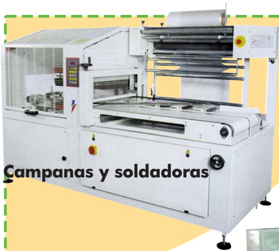
Campanas y soldadoras